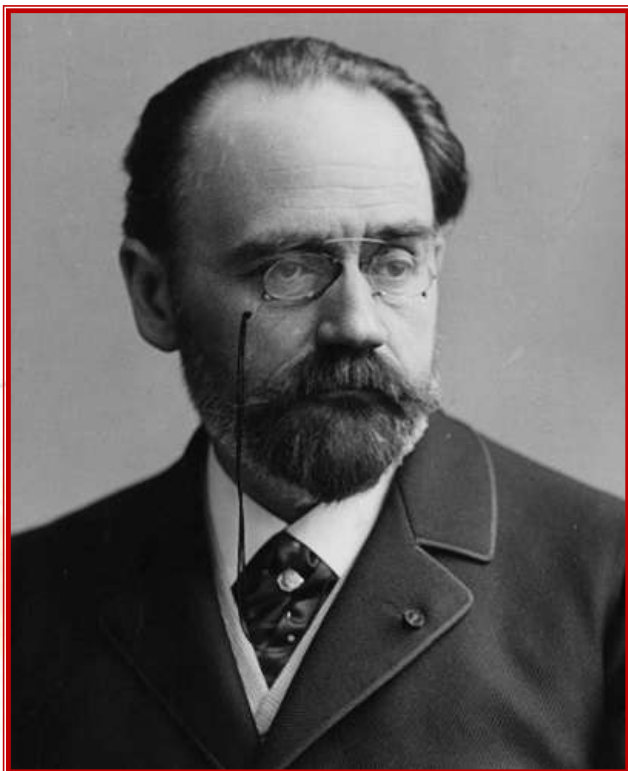
Émile ZOLA 1840-1902