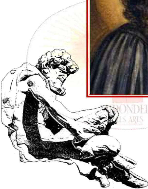
Jean de ROTROU 1609-1650