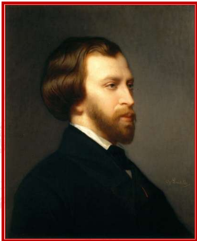
Alfred de MUSSET 1810-1857