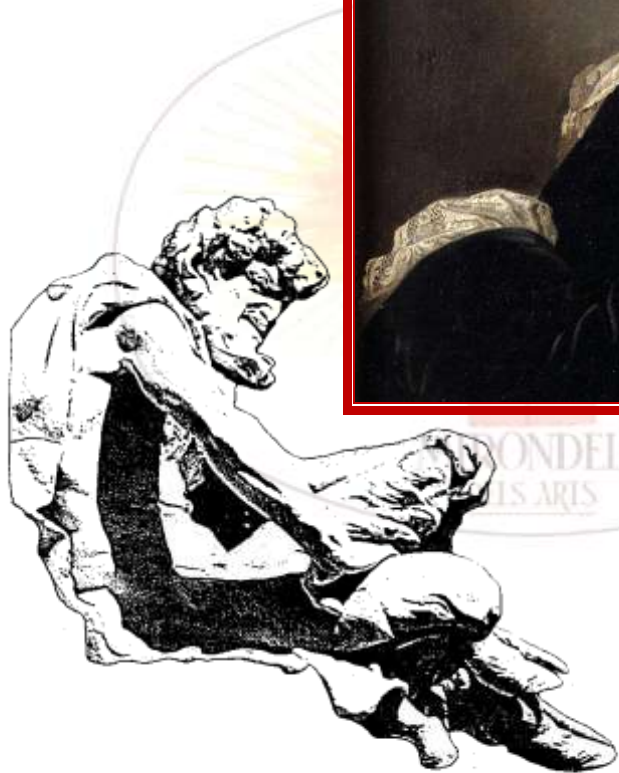
MARIVAUX (Pierre Carlet de Chamblain de) 1688-1763