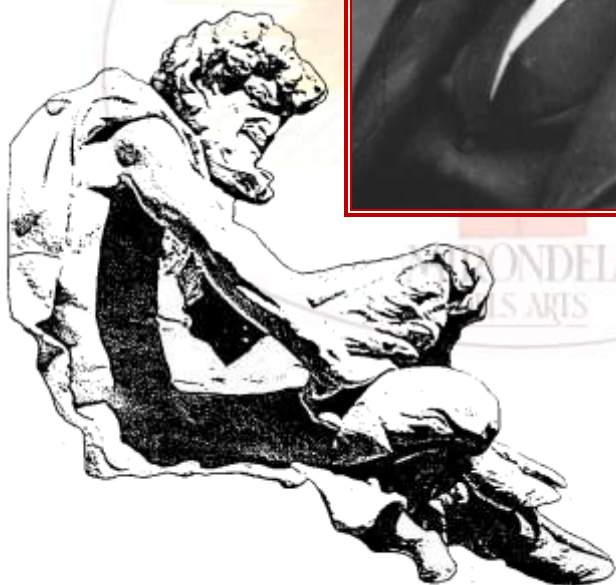
Eugène LABICHE 1815-1888