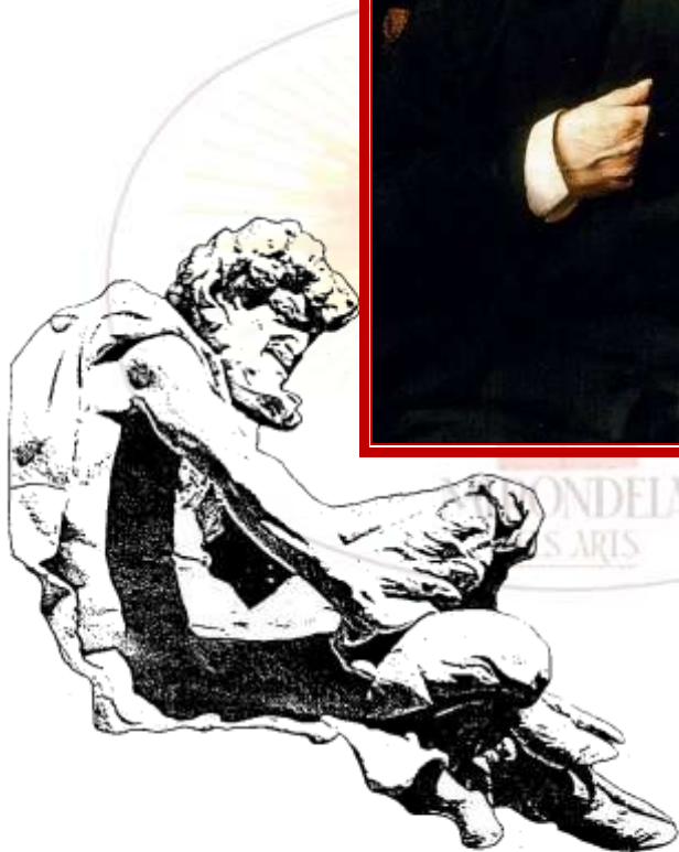
Victor HUGO 1802-1885