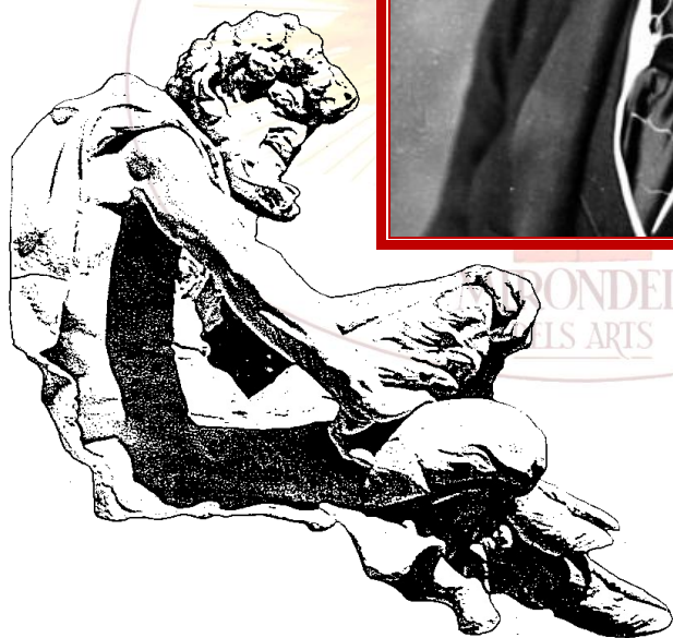
Georges FEYDEAU 1857-1922